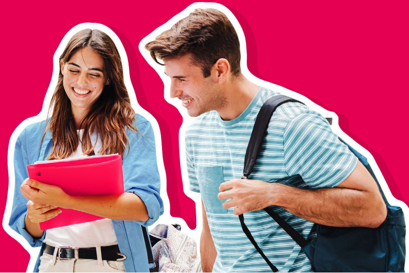
PLUS-Finanzierung | April 3. 2024